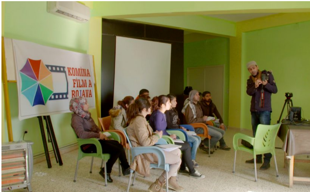
Academia de Cine de Rojava

La Comuna de Cine de Rojava (Komîna Fîlm a Rojava) es un colectivo creado en 2015 por cineastas locales y simpatizantes de la revolución de Rojava, en el norte de Siria, centrado en la producción, la educación y la exhibición de cine. La comuna organiza la Academia de Cine de Rojava para jóvenes cineastas, guionistas, editores y otros profesionales del cine de la región, así como el Festival Internacional de Cine de Rojava , que tiene por objeto acercar el cine al público local, así como crear oportunidades para los cineastas locales y tender puentes con los cineastas internacionales. Sus películas se han proyectado en lugares de todo el mundo, incluido el Festival Internacional de Cine de Rotterdam.