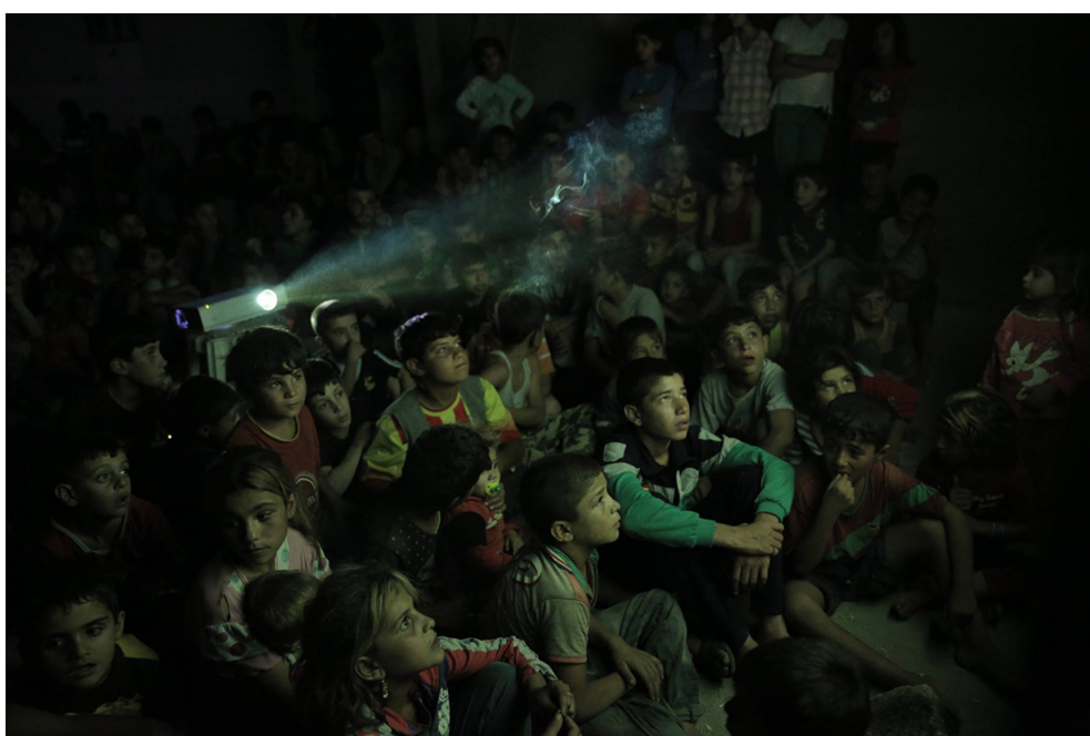
Proyección de películas en Rojava Kurdistán (norte de Siria)

Propuesta para el Ateneo de Madrid "La Maliciosa"