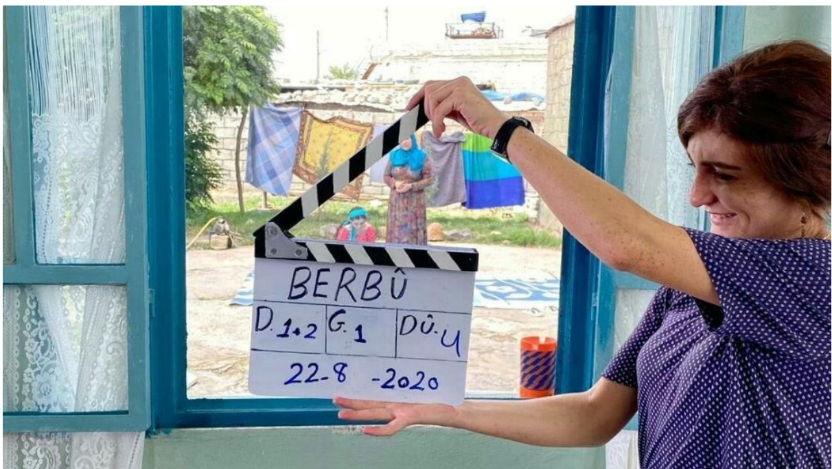
Rodaje de un corto en Rojava Kurdistán (norte de Siria)

Rewend comenzará con el evento itinerante. A partir de enero de 2022, la furgoneta de la Comuna de Cine de Rojava saldrá a la carretera en Italia para visitar una serie de "estaciones". En cada estación se organizará una proyección y un evento especial a cargo de las comunidades locales, incluidas las kurdas. El primer acto tendrá lugar en Calabria, donde se encuentra la comunidad kurda local. La organización implicará a diferentes grupos, como las escuelas, en una serie de tareas y actividades como, por ejemplo, un taller de subtulado y dibujo de carteles. Este encuentro de las culturas kurda y calabresa no será sólo alrededor del cine, sino también de música, arte y literatura. Una de las sedes será el Chiostro Lamezia, un centro cultural ( https://www.facebook.com/chiostrolamezia/ ). Las otras estaciones en Italia estarán en las siguientes ciudades: Lecce, en la región de Apulia, Roma, Nápoles, Milán, Bolonia, Turín y Venecia.