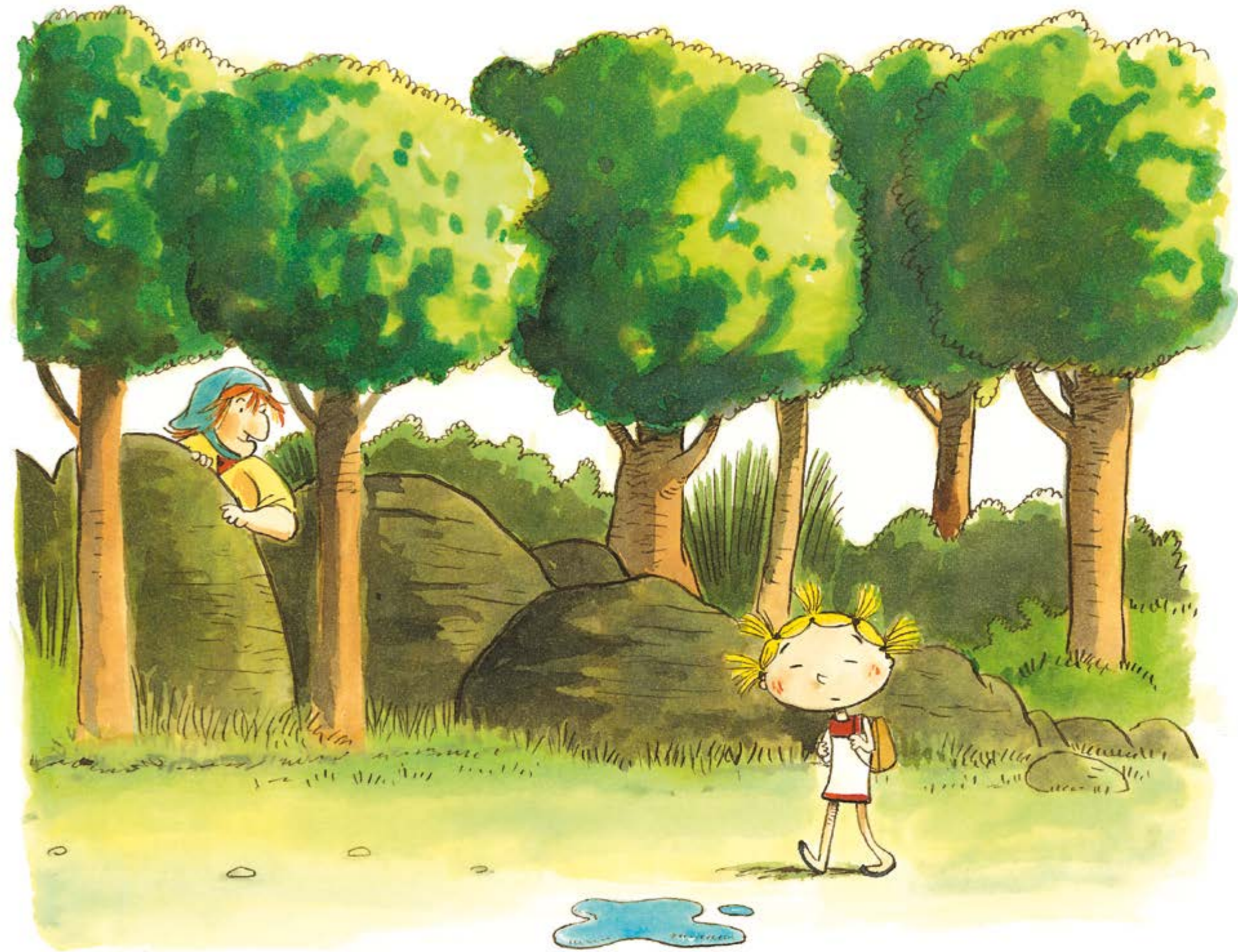
Después pasó una niña de aspecto huraño arrastrando los pies como si estuviera medio dormida.