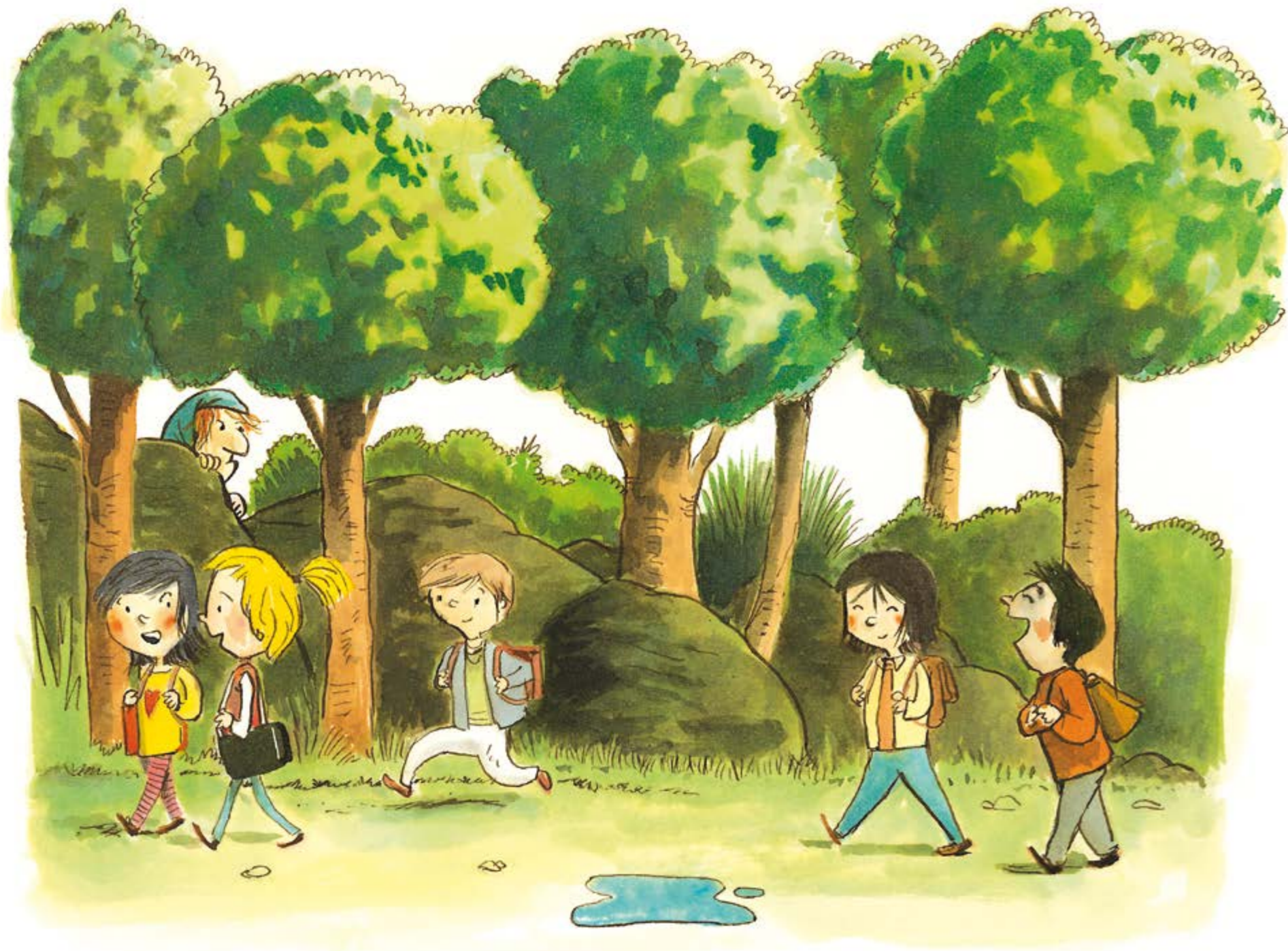
Los primeros peques salieron corriendo, alegres, con la mochila a la espalda.