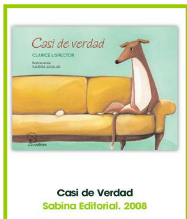
Casi de Verdad Sabina Editorial. 2008