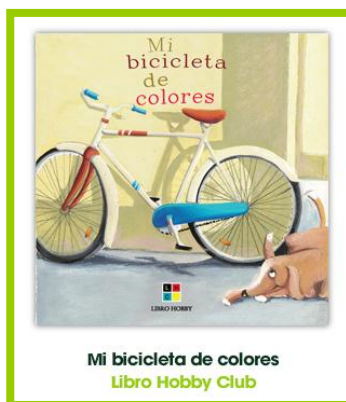
Mi bicicleta de colores Libro Hobby Club