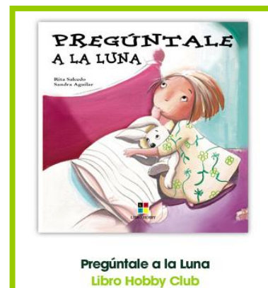
Pregúntale a la Luna Libro Hobby Club