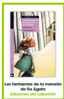
Los fantasmas de la mansión de tía Ágata Ediciones del Laberinto

Página web: http://www.sandraaguilar.es/