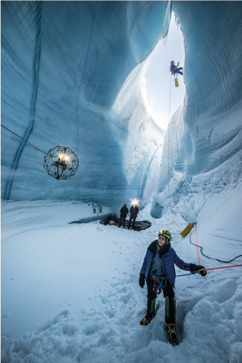
Molino del Kraken, Russel Glacier, Groenlandia. El dron de Flyability se prepara para bajar hacia el fondo del abismo de hielo.