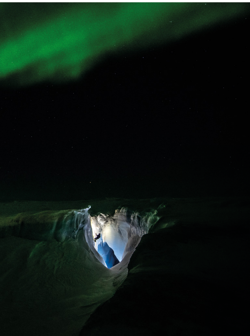
Molino del Kraken, Russel Glacier, Groenlandia. Remontando durante la noche desde las profundidades del hielo iluminados por la aurora boreal.