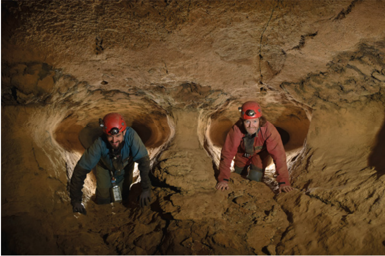
Sistema de Krem Puri, Meghalaya, India. Con más de 25 kilómetros de desarrollo, esta cueva se ramifica como un laberinto geométrico, donde cada encrucijada se repite con el mismo aspecto hasta el infinito.