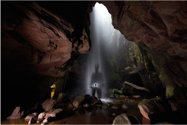
Imawarí Yeuta, Auyan Tepui, Venezuela. La sombra de un explorador se proyecta sobre la gran cascada de Rátó, la diosa del agua.