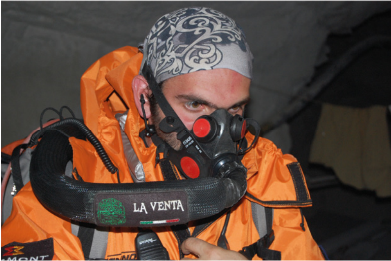
Cueva de los Cristales, Naica, Chihuahua, México. Antes de entrar en el infierno de la cueva ponemos a punto el respirador y verificamos las comunicaciones por radio.