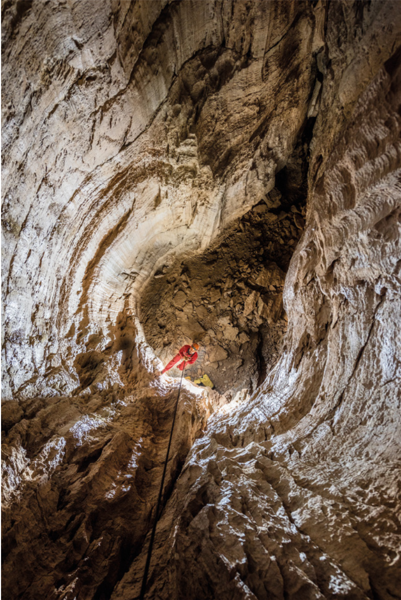
Sistema de los Piani Eterni, Parque Nacional de los Dolomitas de Belluno, Italia. Descendiendo a los pozos que llevan al laberinto paleofreático profundo.