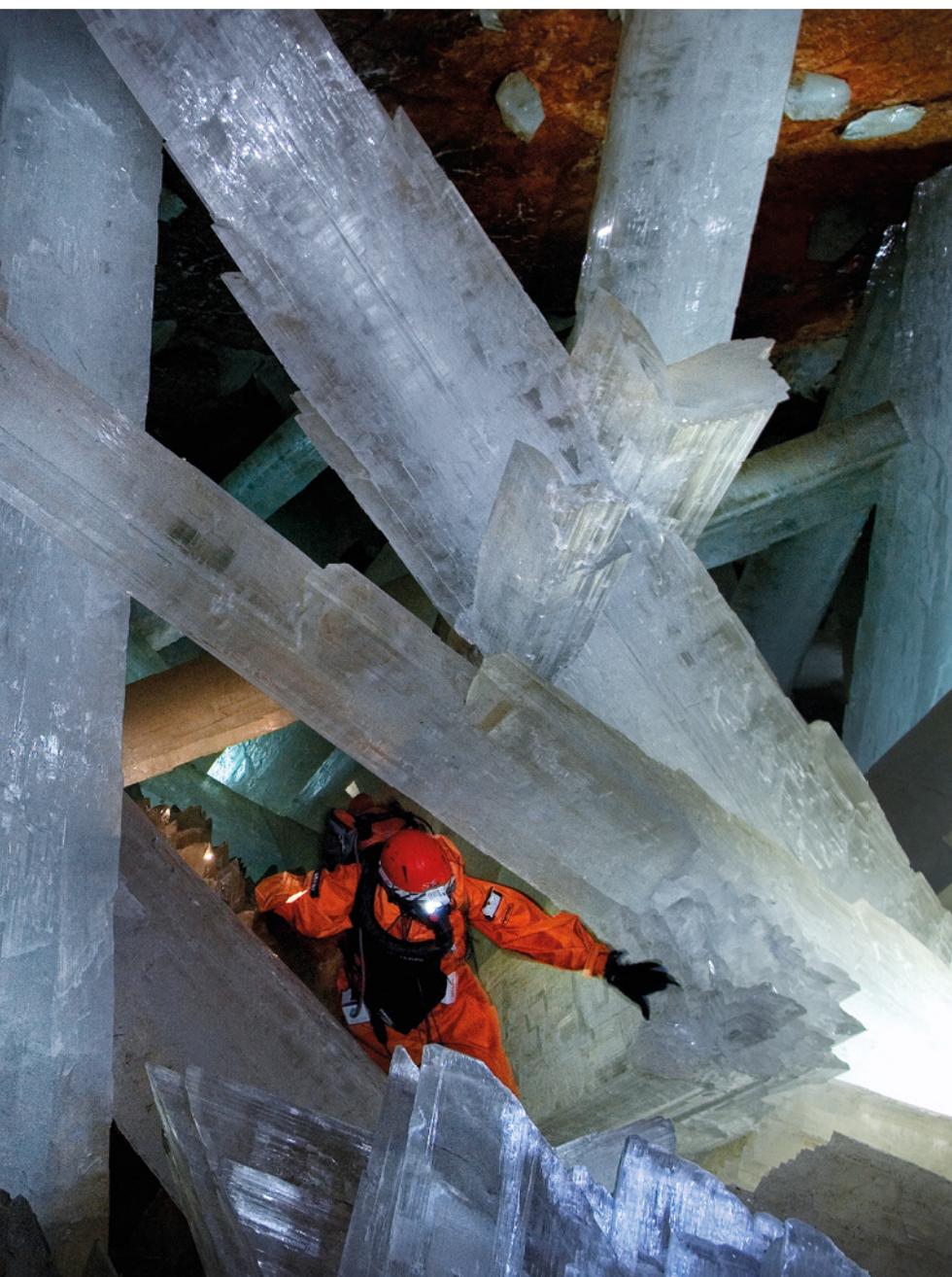
Cueva de los Cristales, Naica, Chihuahua, México. Con el pesado traje congelado bautizado como «Tolomea» nos movemos lentos a través de la selva de cristales de selenita.