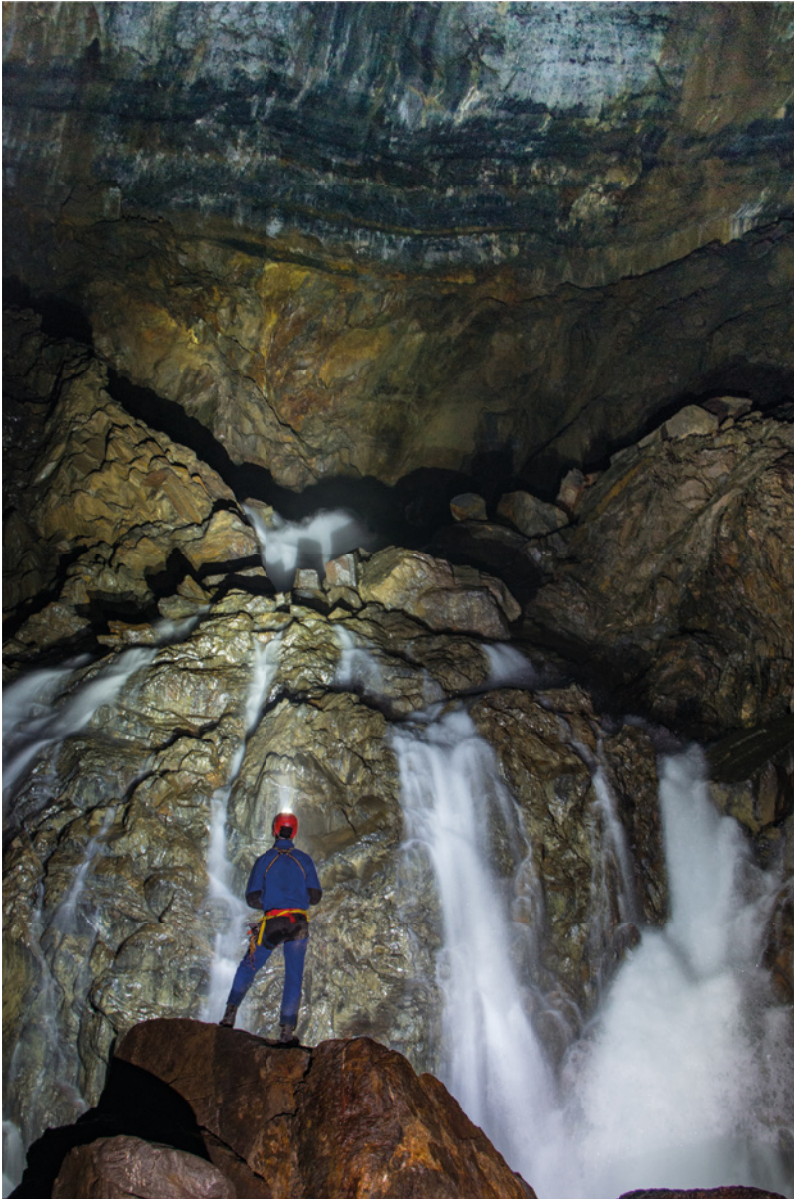
Abismo de la Pierre Saint-Martin, Pirineos, Francia. El río subterráneo que atraviesa la gran Sala de la Verna, el fondo histórico de la Pierre Saint-Martin.