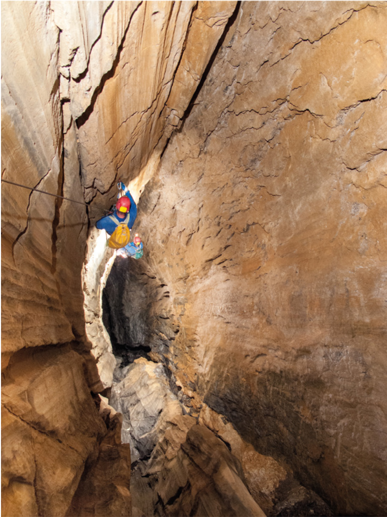
Abismo de la Pierre Saint-Martin, Pirineos, Francia. Descenso del Pozo Lèpineux, una vertical de 320 de profundidad. Muy cerca de su base se produjo el accidente que le costó la vida a Marcel Loubens.