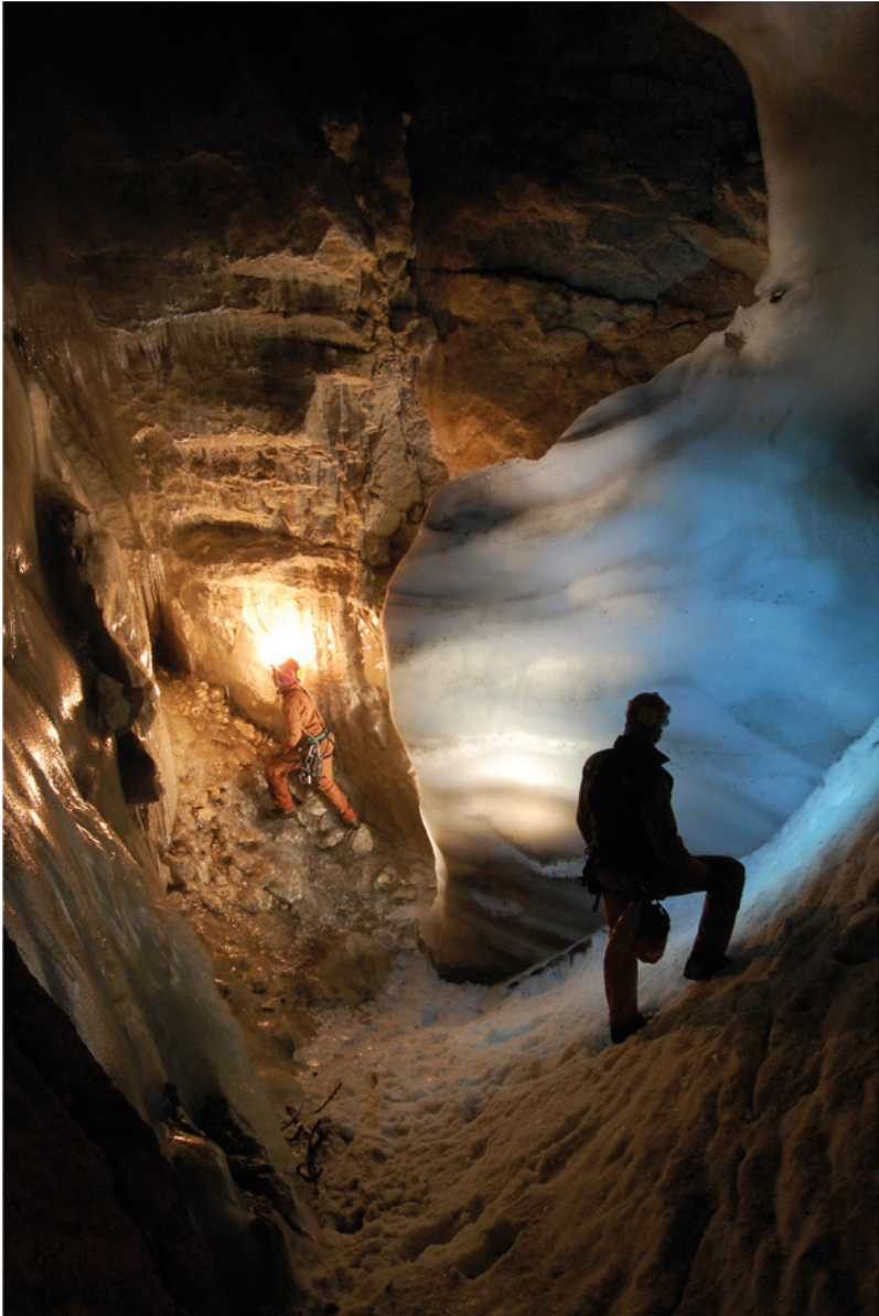
Sistema de los Piani Eterni, Parque Nacional de los Dolomitas de Belluno, Italia. Las zonas iniciales del abismo están ocupadas por grandes depósitos de hielo subterráneo.