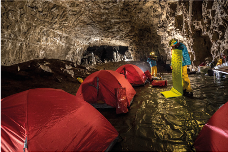
Karst clásico, Trieste, Italia. El campo base de los astronautas durante las misiones de adiestramiento CAVES organizadas por la Agencia Espacial Europea.