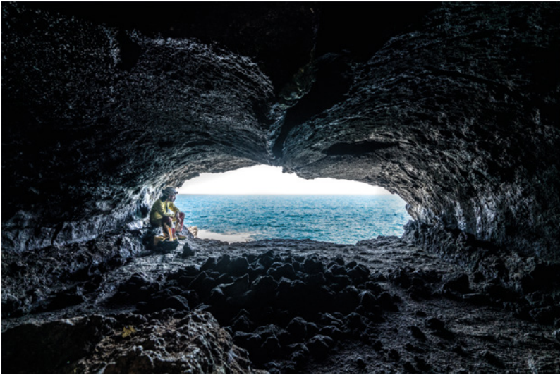
Lanzarote, islas Canarias, España. Un tubo de lava se lanza al océano Atlántico, como la boca de un gigante de piedra que lucha contra los monstruos del mar.