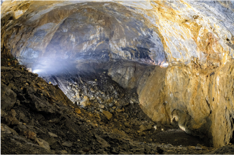
Abismo de la Pierre Saint-Martin, Pirineos, Francia. La Sala de la Verna es el ambiente subterráneo más grande descubierto hasta ahora en Europa, con 2,6 millones de metros cúbicos de volumen. En la foto, las siluetas de los espeleólogos se pierden en la inmensidad de la cueva.