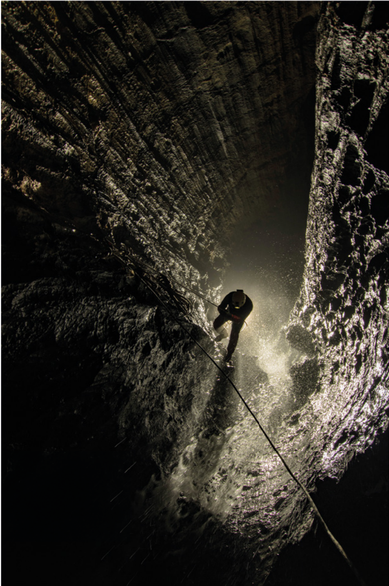
Abismo de la Pierre Saint-Martin, Pirineos, Francia. Desde las primeras exploraciones de los años cincuenta, este sistema subterráneo ha sido explorado a lo largo de más de 80 kilómetros de desarrollo y 1410 de profundidad.