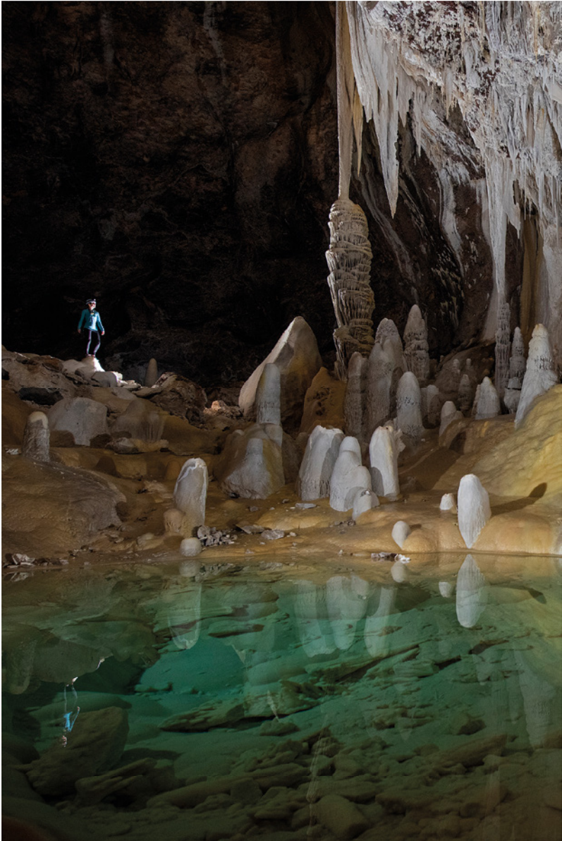
Cueva Lechuguilla, Nuevo México, EE.UU. Estalactitas y estalagmitas formadas en el curso de cientos de miles de años mediante la precipitación del carbonato de calcio.