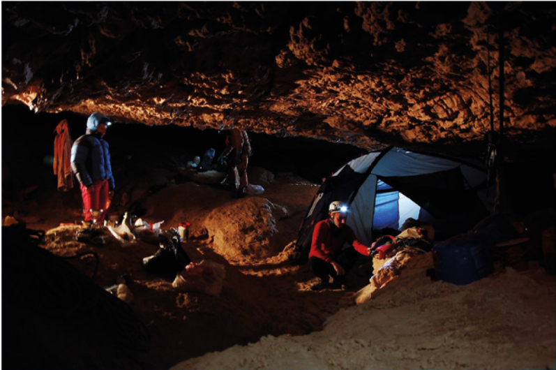
Sistema de los Piani Eterni, Parque Nacional de los Dolomitas de Belluno, Italia. La «Posada de los Bucaneros» es el principal campamento subterráneo del que parten las exploraciones hacia las regiones más remotas del sistema y el acceso de la Cueva Isabella.