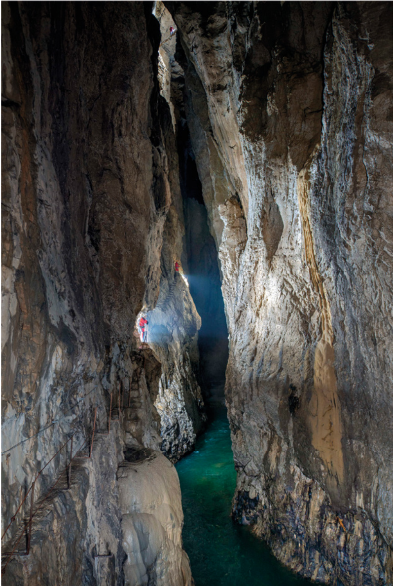
Cuevas de Škocjan, Divača, Eslovenia. La vía de rescate, esculpida en la roca entre 1884 y 1890, serpentea a lo largo de las paredes escarpadas sobre el tumultuoso río Reka.