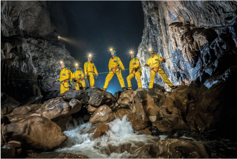
Cuevas de Škocjan, Divača, Eslovenia. Astronautas de la NASA, la ESA, la JAXA, la CSA y ROSCOSMOS vuelven sobre los pasos de los pioneros que exploraron el Reka subterráneo más de un siglo antes.