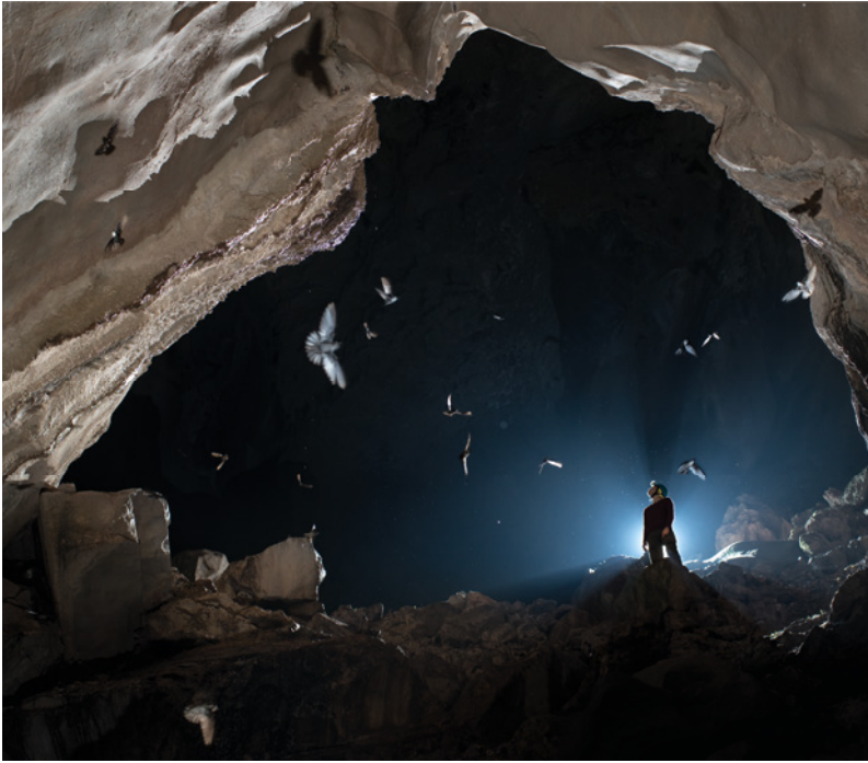
Río subterráneo Saint Paul, Palawan, Filipinas. Centenares de miles de golondrinas Aerodramus anidan en las salas subterráneas adentrándose a lo largo de kilómetros en el interior de la montaña.