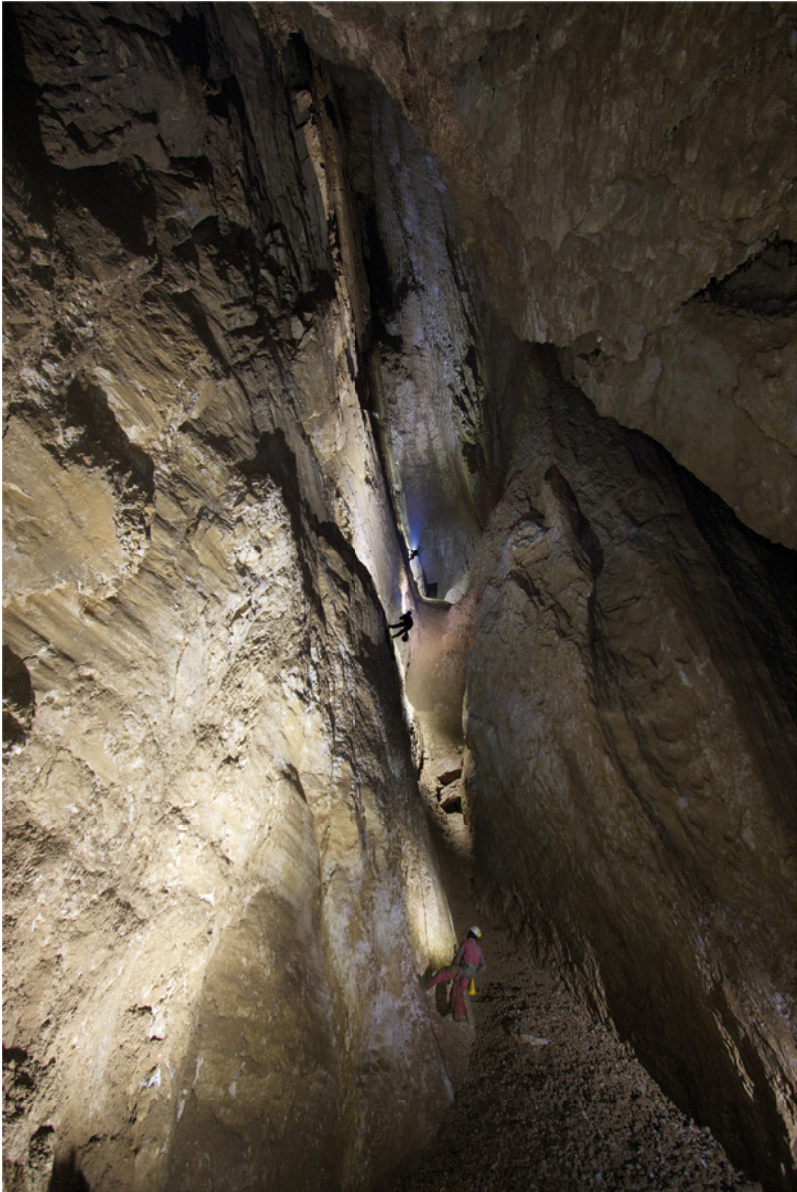
El Abismo de la Vía Antica, Spluga della Preta, montes Lessini, Veneto. El acceso a esta gran sala no fue descubierto hasta 2003, después de casi ochenta años de exploraciones.