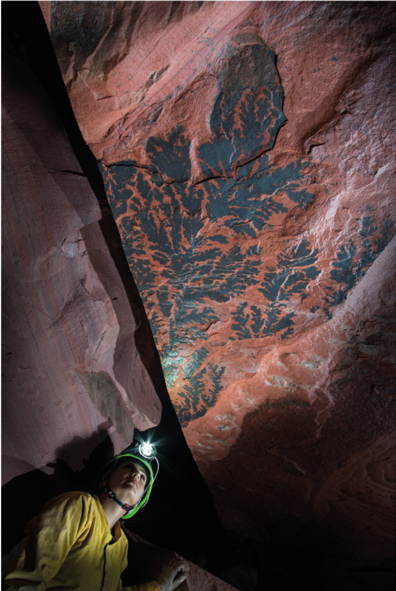
Cueva de Yanadaima Ewutu, Sarisariñama Tepui, Venezuela. Dentro de los tepuyes de Venezuela el mundo mineral y el microbiológico con frecuencia se funden, creando formaciones enigmáticas de una rara belleza.