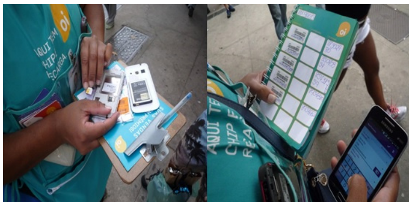
Imagen 3. Vendedora reemplazando y registrando un chip Oi.

De esta manera, los vendedores realizan una forma precaria de trabajo informacional poco calificado, ya que distribuyen, recolectan, almacenan y procesan información –tanto para la compañía como para sí mismos en relación con la administración de sus ventas–. Para ello, utilizan los medios digitales (Cortada, 2011), actividad para cuyo desarrollo no es necesario ningún tipo de entrenamiento específico, excepto aquel que las clases trabajadoras adquieren y pagan ellas mismas en su incorporación cotidiana a los medios digitales (véase la imagen 3).