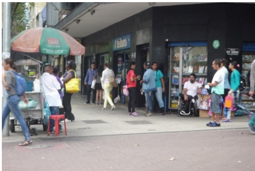
Imagen 4. Núcleo de ventas de la esquina (personas como infraestructura).

supervisores, quienes pueden beneficiar a algún vendedor, basándose en afinidades personales y amistad. Las esquinas y banquetas se convierten en espacios públicos donde el trabajo acontece, mezclando las diversas lógicas de los encuentros cotidianos en la ciudad. Es común que las esquinas de los vendedores se vuelvan lo que podríamos llamar un “núcleo de ventas de la esquina”, donde éstos se reúnen apoyándose unos a otros. Así, crean formas emergentes de espacialidades inestables, donde el trabajo y el valor circulan, y se negocian las fronteras sociales del centro de la ciudad.