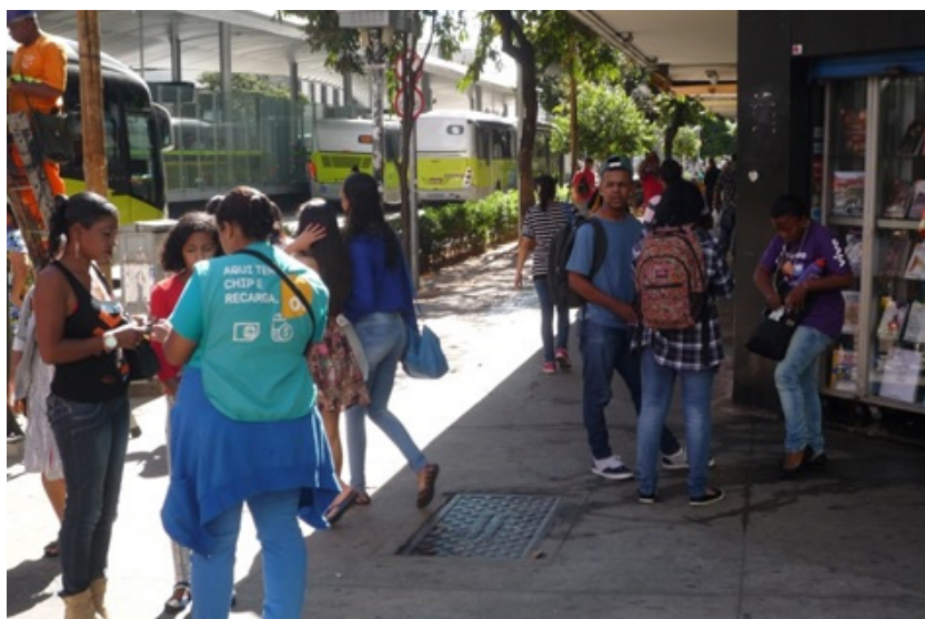
Imagen 1. Vendedores de chip con camisetas de las compañías Oi y Vivo.

El mercado de planes de prepago parece ser más dinámico y competitivo, lo cual refleja la prevalencia de este servicio en Belo Horizonte. Aparentemente, este mercado sigue las condiciones económicas de los sectores populares. Así, en Belo Horizonte, uno puede obtener un chip (sim card) en una de las numerosas tiendas concesionarias de las compañías de telefonía, esparcidas en toda la ciudad. También se puede comprar un chip en la mayoría de los puestos de periódicos. No obstante, aquí me enfocaré en la forma particular de distribución comercial que llevan a cabo los vendedores callejeros: os vendedores de chip (véase la imagen 1).